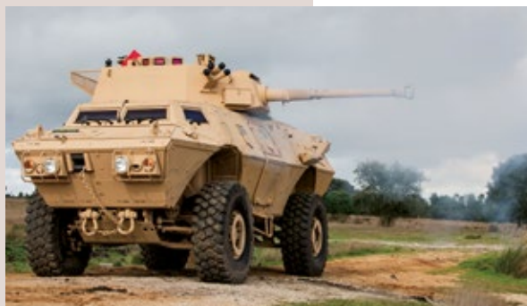
COCKERILL® CSE 90LP