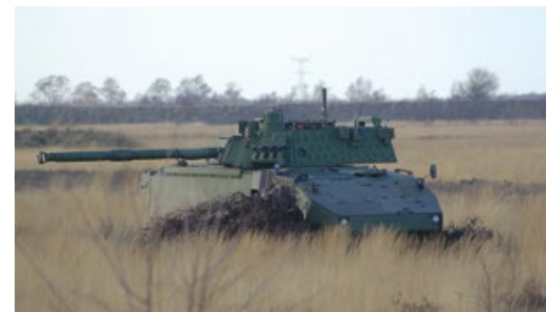
COCKERILL® LCTS 90MP