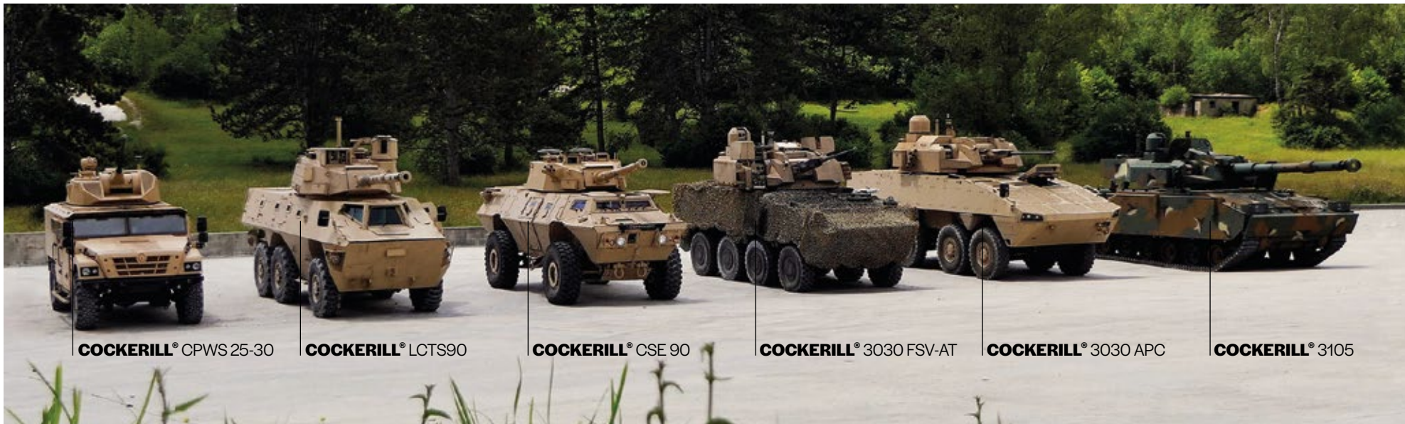
COCKERILL® CPWS 25-30