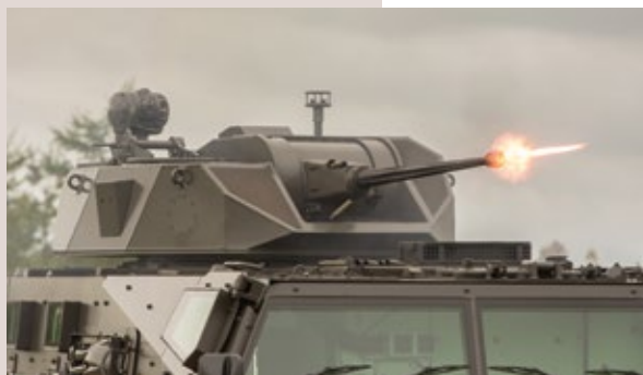
COCKERILL® CPWS 25-30

John Cockerill Defense diseña, fabrica, integra y mejora los sistemas de torreta-cañón para toda la gama de calibres de 25 a 120 mm. Los sistemas de armamento de John Cockerill Defense encarnan la esencia de la marca Cockerill® combinando una gran potencia de fuego y un peso ligero, garantizando prestación y protección por un lado y aerotransportabilidad por otro. Son modulares y están diseñados para evolucionar, con un coste moderado, adaptándose a las necesidades de sus usuarios.