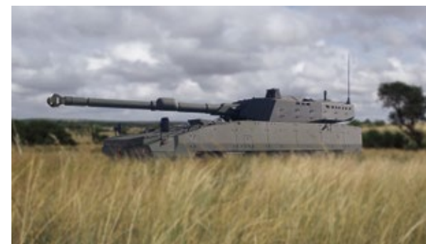
COCKERILL® XC-8 105-120HP

Un peso ligero y una gran potencia de fuego para los vehículos blindados de gran movilidad.